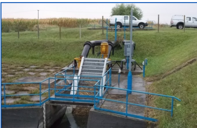
Kaba-Tetétleni szivattyútelep mozgógereb beépítése