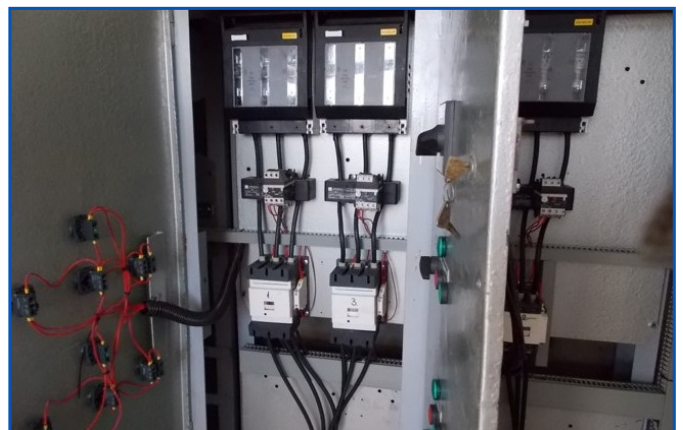
Papzugi szivattyútelep villamos rendszer felújítása