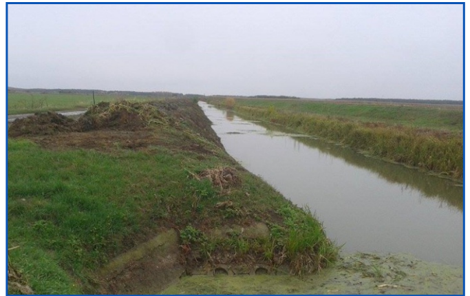
Kődombszigeti-főcsatorna iszaptalanítás után