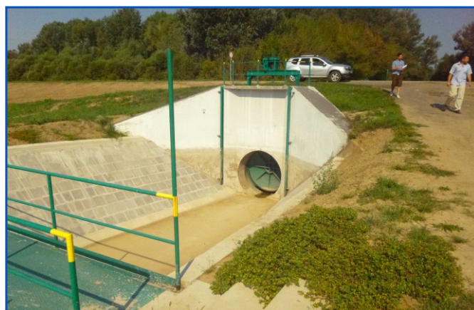
Halastói-tápcsatorna leeresztő műtárgy