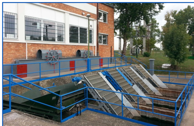
Hamvas II szivattyútelep

Megtörtént a folyók vízszintváltozásainak a folyamatos figyelését segítő vízrajzi létesítmények felülvizsgálata is. Összességében a mértékadó és az árvízi vízmércék állapota jó, környezetük rendezett, a regisztráló és távjelzős vízmércék működőképeseek.